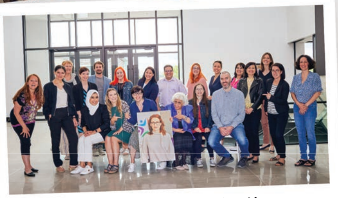
Notre belle équipe en 2022