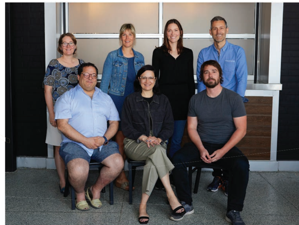
Un précieux conseil d'administration