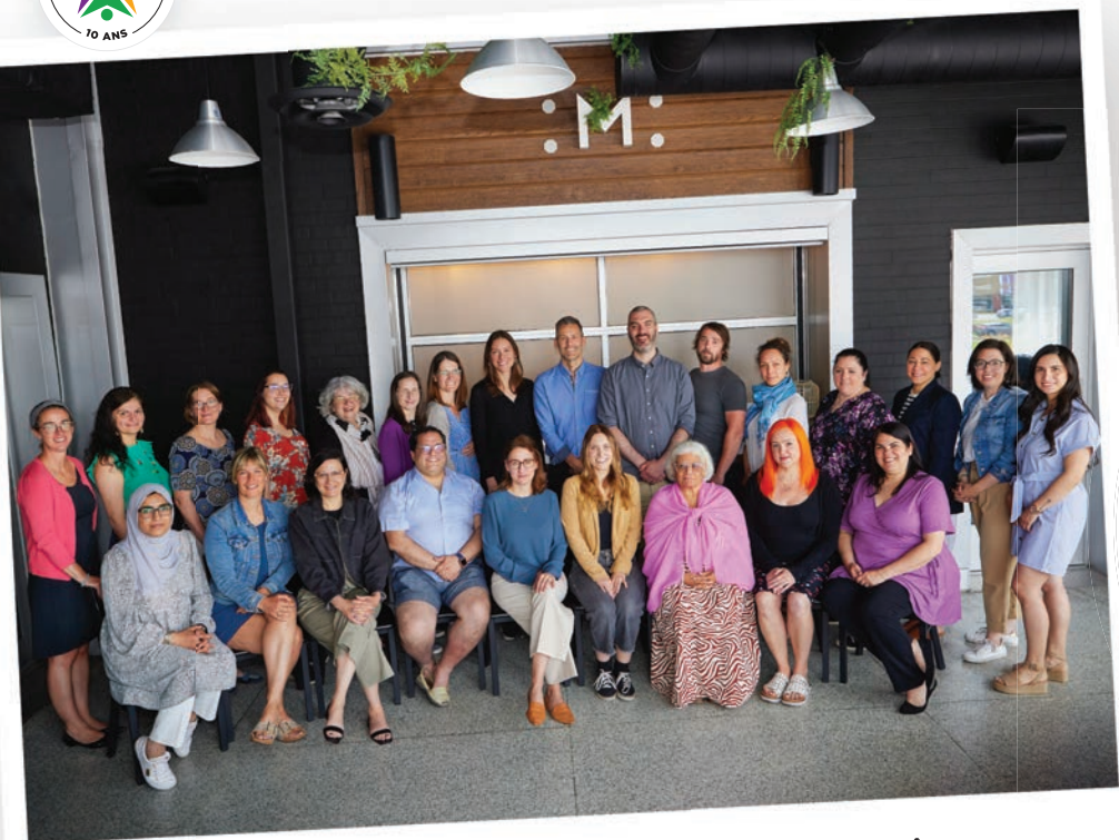
Une équipe qui fait toute la différence