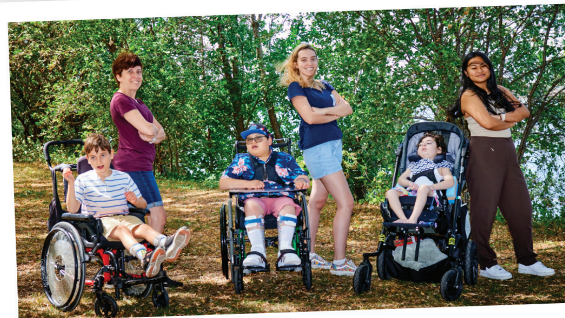
Les super-gardiennes spécialisées

Chapeau à toute l'équipe qui fait preuve d'ingéniosité année après année pour dénicher des perles rares et ce, malgré un contexte de pénurie de main-d'œuvre.