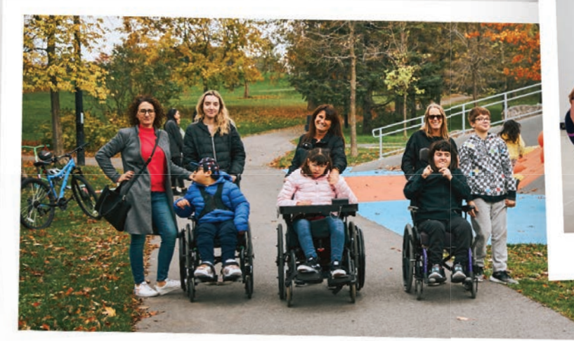
Partenaire à la conception du Parc St-Joseph