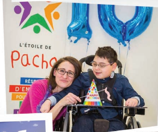
Soirée bénéfice 2016 "Souper Spaghetti"