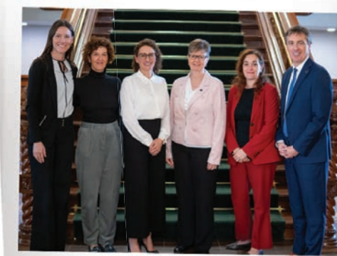
Merci à l'équipe du PLQ pour son soutien